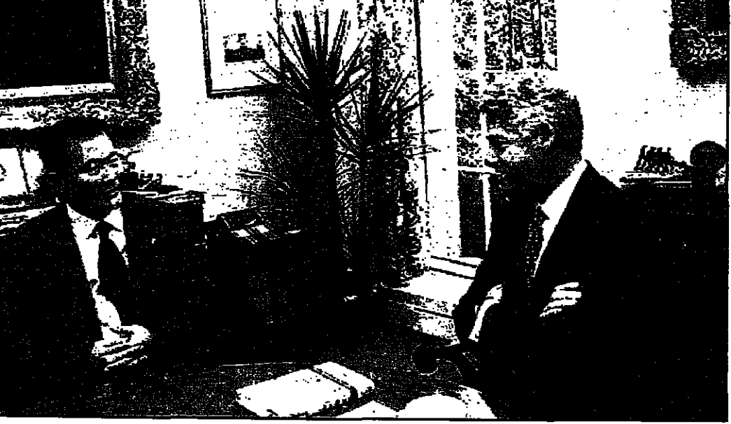
الرئيس الأمريكي بيل كلينتون لدى لقاءه مع الرئيس الصيني جينغ ديزه (ديزده)

قالت وزارة العدل الأمريكية إن عالم طبيعة أمريكي كان يعمل في معمل نووي قومي اعترف للاتحاد السوفياتي بتقديم معلومات عسكرية سرية للحكومة الصينية عام 1985. وهو جينغ دي (58 عاماً) وهو خبير في طاقة الميزن نفسه للمنظمات الاحتمالية أسس واعترف أنه أمم عملاء صينيين خلال زيارته للصين عام 1985 بمعلومات مفصلة عن عمله في معمل لوس الاموس النووي رغم علمه أن هذه المعلومات سرية.